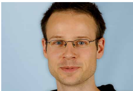
Ruedi Leder Softwareentwicklung